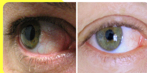
قبل از درمان

ناخنک حتی با وجود جراحی مناسب، ممکن است (به ویژه در افراد جوان) عود نماید. گاهی برای جلوگیری از عود ناخنک، از پرتودرمانی سطحی یا داروهای خاصی درحین عمل و یا همزمان پیوند ملتحمه از قسمت سالم برروی منطقه ای که ناخنک برداشته شده است، استفاده می شود. محافظت چشم در برابر میزان بیش از حد پرتو فرابنفش با استفاده از عینک آفتابی مناسب، جلوگیری و درمان خشکی چشم و پیشگیری از رسیدن گرد و غبار به آن نیز ممکن است مفید باشد.