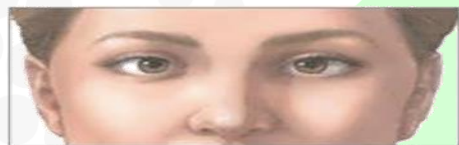
قبل از درمان

در صورت وجود استرابیسم باید معاینه چشمی کامل انجام شود. تشخیص و درمان زود هنگام ممکن است از عوارض بعدی بینایی جلوگیری کند.