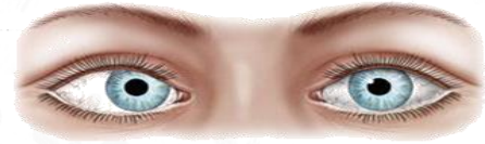
انحراف به داخل