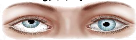
انحراف به خارج